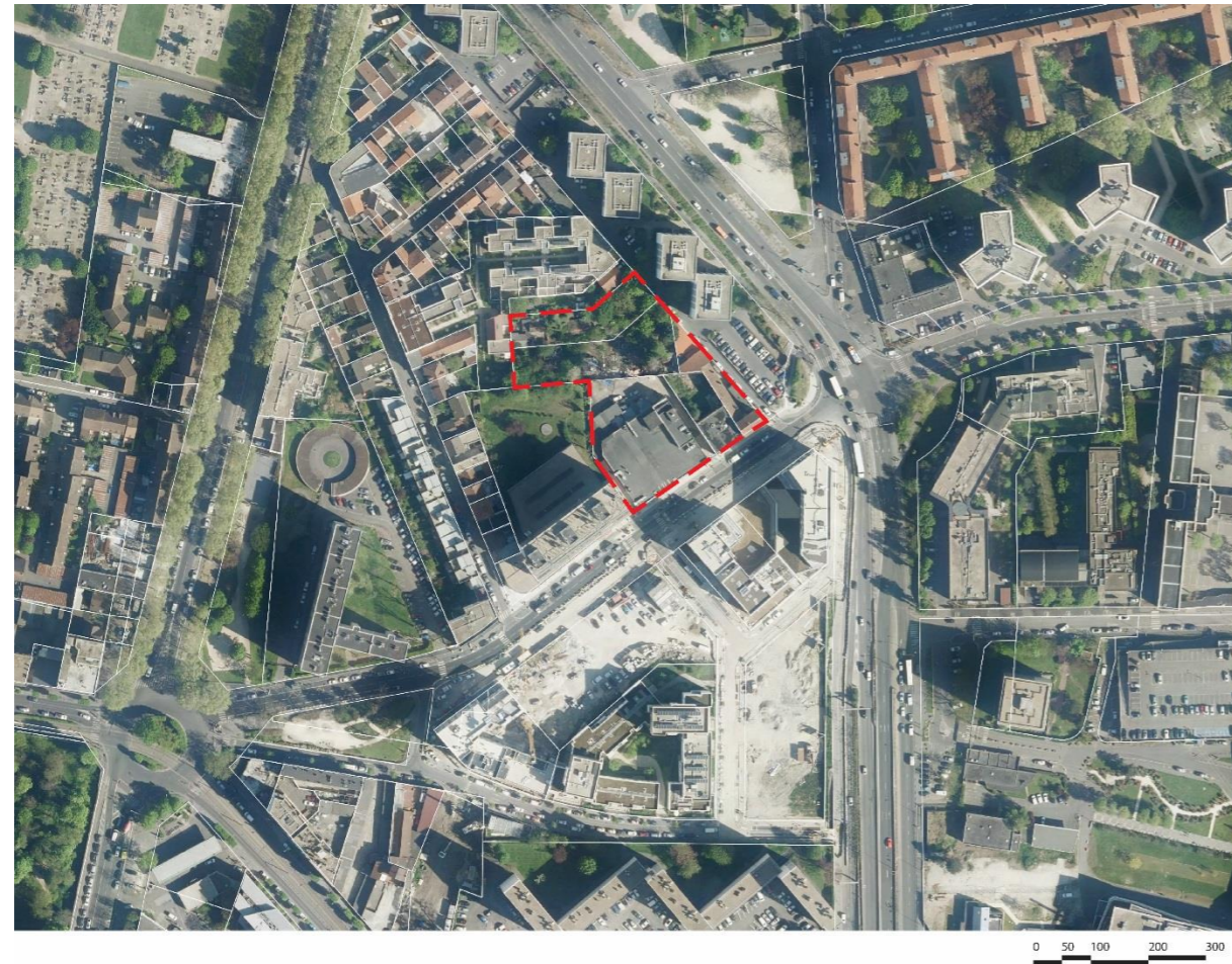
Plan de situation (Cadastre 2017, ortho photo 2017)

Le secteur Strasbourg Saint-Rémy, d'une superficie de 6 000 m 2 environ, est localisé dans la commune de Saint-Denis, le long de la rue de Strasbourg, au nord-est du parc de la légion d'honneur. Il est situé à l'articulation des rues de Strasbourg et de l'avenue Marcel Cachin.