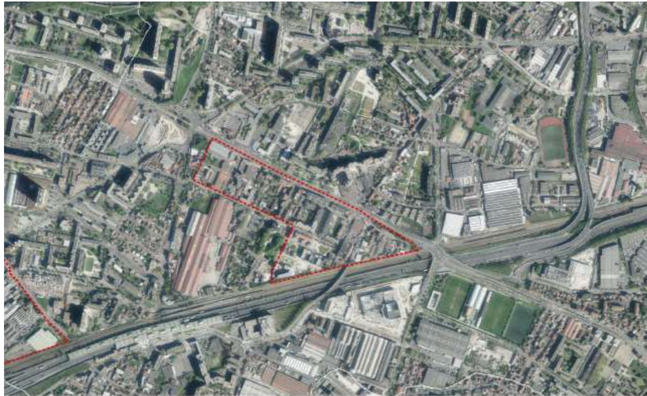
Champagnole-Mécano, vue satellite et périmètre de l'OAP

NOTA : Le site de KDI et ses alentours sont abordés à travers l'OAP de projet « Six Routes – Schramm », le reste du quartier de la Mairie de La Courneuve est traité dans cette OAP « secteur Champagnole-Mécano ».