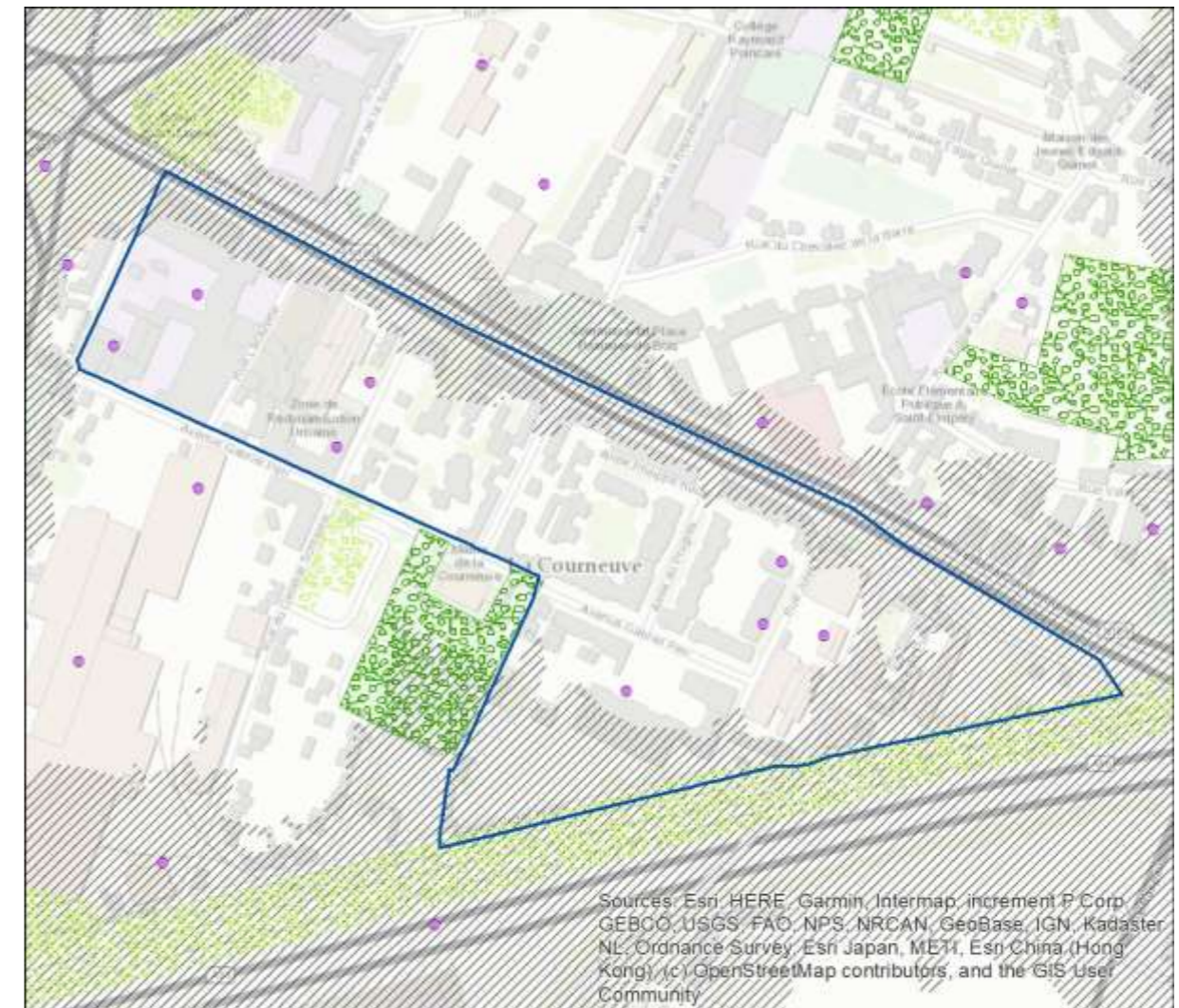
Tableau - Enjeux environnementaux du site d'OAP sectorielle « Champagnole - Mécano ».