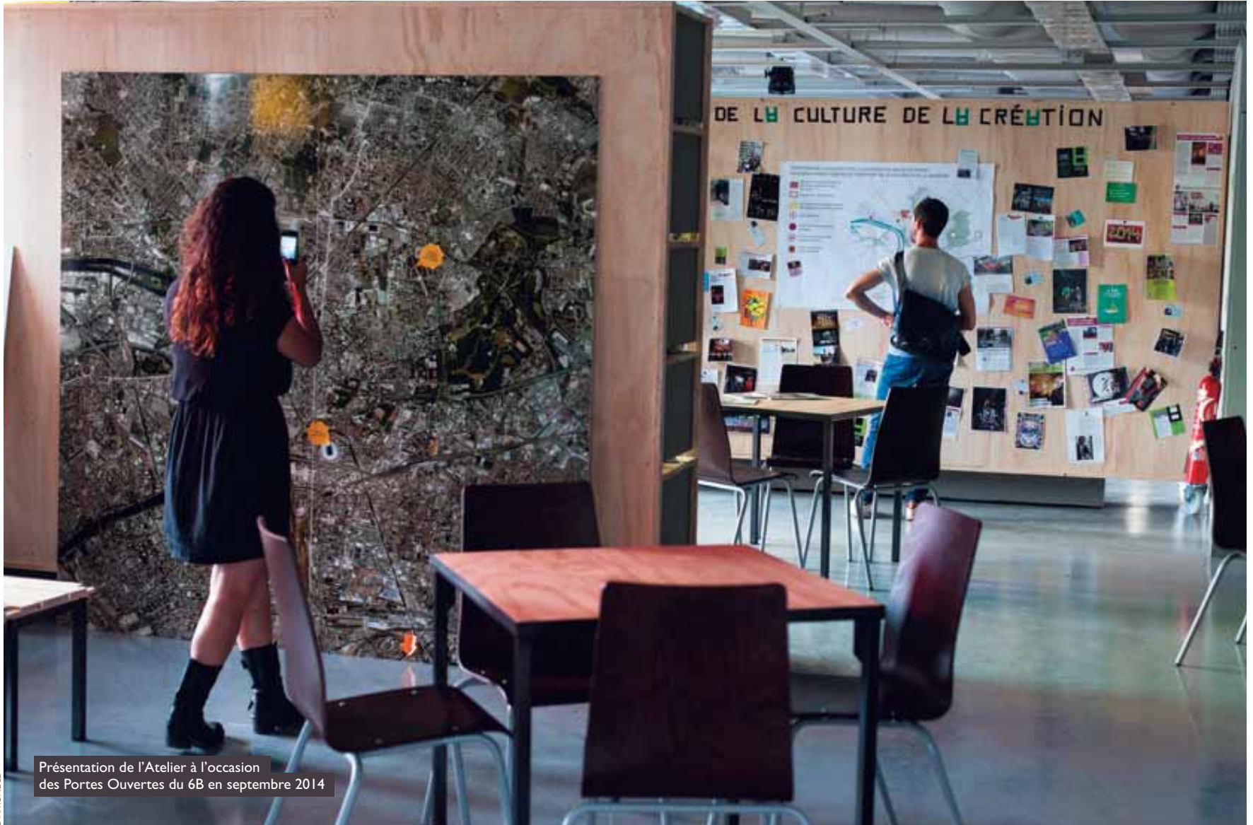
Présentation de l'Atelier à l'occasion des Portes Ouvertes du 6B en septembre 2014