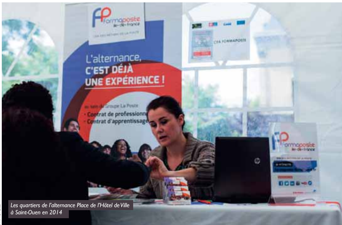
Les quartiers de l'alternance Place de l'Hôtel de Ville à Saint-Ouen en 2014

Via les Quartiers de l'Alternance ou encore la toute nouvelle Nuit de l'Apprentissage, Plaine commune promeut l'emploi via la formation en alternance.