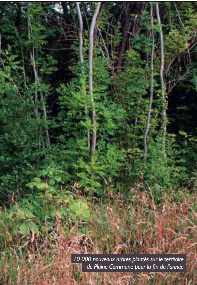
10 000 nouveaux arbres plantés sur le territoire de Plaine Commune pour la fin de l'année