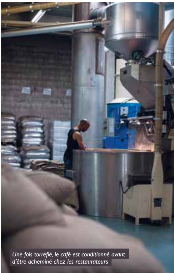
Une fois torréfié, le café est conditionné avant d'être acheminé chez les restaurateurs

« On n'a jamais autant bu de café dans le monde ! Mais les habitudes de consommation ont beaucoup changé. Les bars sont de plus en plus nombreux à mettre la clé sous la porte. Les amoureux du petit noir préfèrent investir de grosses sommes dans des torréfacteurs dits domestiques. La mode des dosettes est également un reflet de notre société : ces petites capsules ont permis d'affiner le goût des consommateurs. Je pense que d'ici quelques années, elles pourront être entièrement recyclées. Pendant les années 1960, le café 70 % arabica dominait le marché français. Mais depuis une vingtaine d'années, c'est le 80 % arabica qui est le plus prisé dans l'Hexagone. Les Français apprécient de moins en moins l'amertume d'un café un peu corsé, comme en témoigne le succès des cafés Starbucks qui vendent des boissons très sucrés. » ■